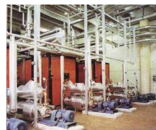
Centrale termica gruppo caldaie