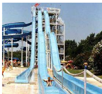
Acqua Piper – Kamikaze