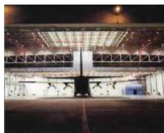
Hangar di sverniciatura e verniciatura aerei (BR)