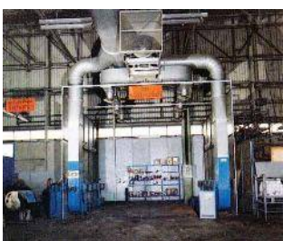
Impianto di abbattimento ed estrazione vernici