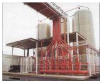
Centrale antincendio – stoccaggio da 600 Mc