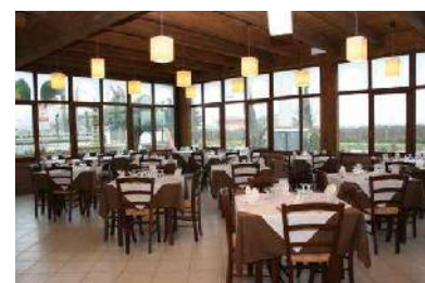
Hotel Garden – sala ristorante 110 mq. realizzata in legno lamellare