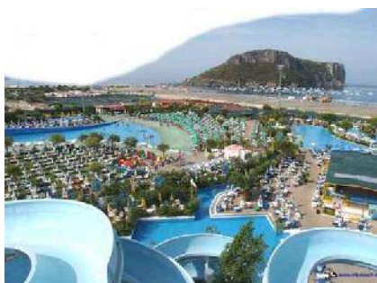
Aqua Fans (CS) vista panoramica