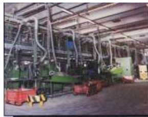
Impianto d'aspirazione fumi di saldatura