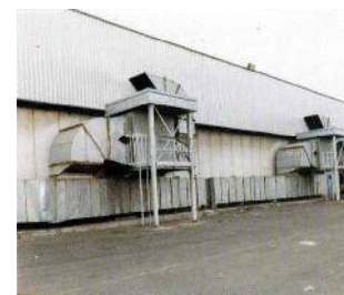
Centrale di aspirazione gas di scarico