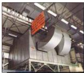
Centrali di termoventilazione