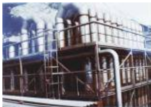
Depuratore fumi forni Italsider (Darfo)