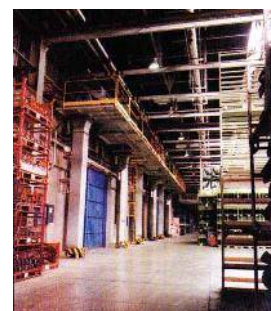
Veli d'aria su portoni