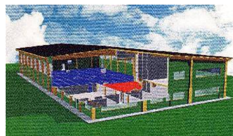
Centro sportivo/benessere polivalente 'progetto' – in fase di realizzo