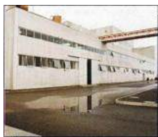
Corpo servizi (B)