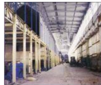
Fase di realizzazione di capannone industriale