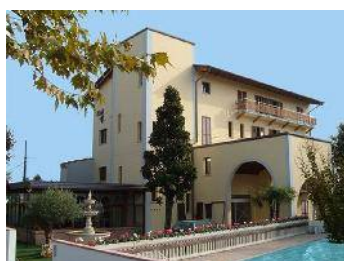
Hotel Garden – Comacchio