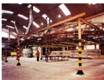
Trasportatore aereo birotaia