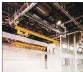
Particolare del trasportatore aereo