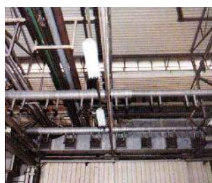
Impianto estrazione gas di scarico