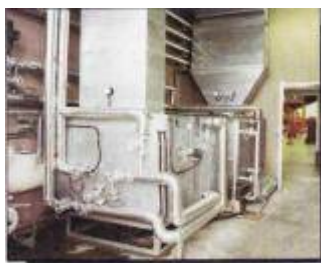
Centrali di condizionamento per centrale vernici