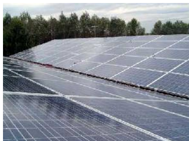
Impianto fotovoltaico su edificio