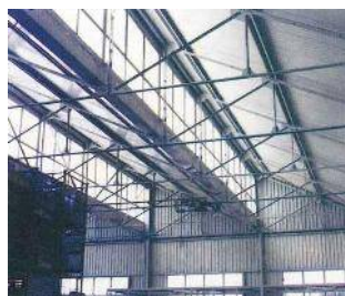
Capannone industriale fase di realizzazione (NA)