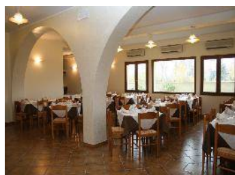
Hotel Garden – sala interna