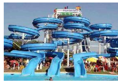
Jo Lido - gruppo scivoli