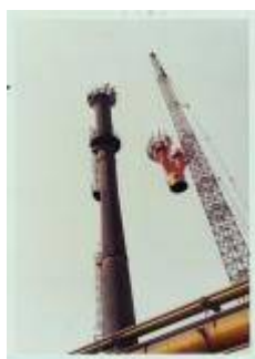
Sostituzione bruciatori esalazione gas candela altiforni Italsider (Bagnoli 'NA')