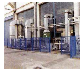
Centrale di condizionamento