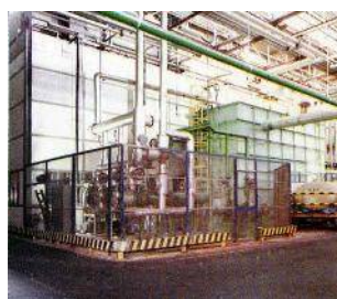
Centrale di raffreddamento acque