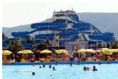
Acqua Piper (Roma) gruppo scivoli