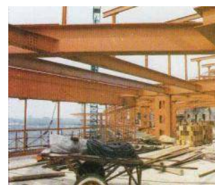
Struttura portante edificio industriale 'particolare profili'