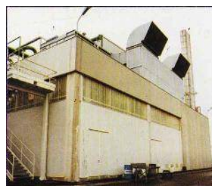
Centrali trattamento aria da 220.000 mc/h (BR)