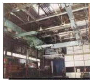
Centrale di raffreddamento