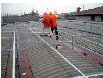
Impianto Fotovoltaico (FE) Struttura portante moduli