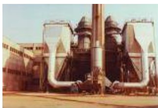
Elettrofiltro depuratore fumi Stoppani (GE)