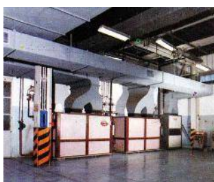
Impianto di estrazione ammoniacca